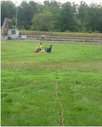
Caratterizzazione sismica- Lonate Pozzolo (VA)