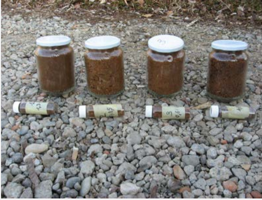
Prelievo campioni per analisi ambientali