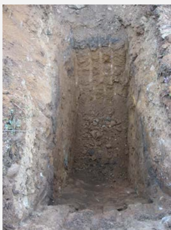
Caratterizzazione litologica con scavi esplorativi