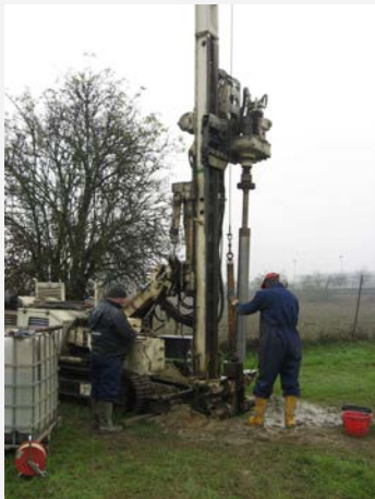
Esecuzione sondaggio geognostico – Merlino (LO)