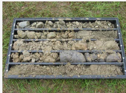
Carotaggio – Merlino (LO)