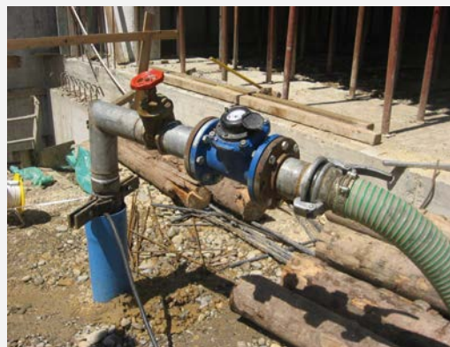
Esecuzione prova di portata