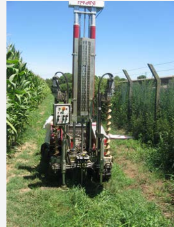
Esecuzione prova penetrometrica - Nosate (MI)