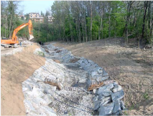
Intervento di ripristino alveo