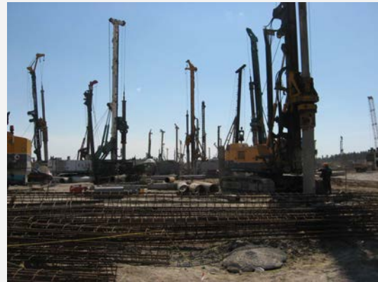
D.L. geologica nell'esecuzione di pali - Vyborg - Russia